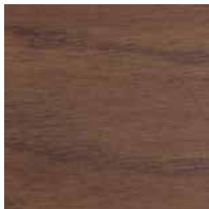
Ash Grey Oak