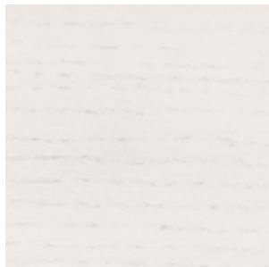
White Stained Oak