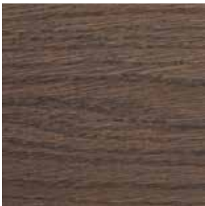
Walnut Stained Oak