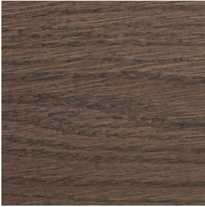
White Stained Oak