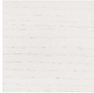
Walnut Stained Oak